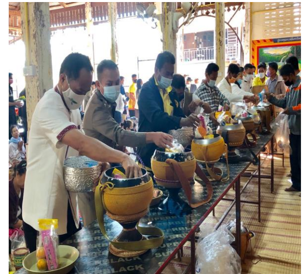
นำเงินบริจาคจากทุกภาคส่วนมอบให้กับครอบครัวผู้ป่วยยากไร้ทุกเดือน จำนวน 6 ครั้ง/6 ครอบครัว